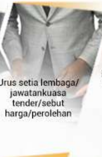
Urus setia lembaga/jawatankuasa tender/sebut harga/perolehan