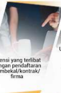
Agensi yang terlibat dengan pendaftaran pembekal/kontrak/firma